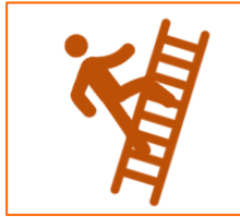
Werken met ladder